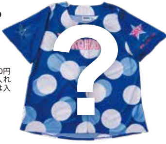
※画像は昨年のユニフォームイメージです